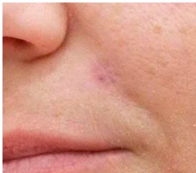
FIGURA 2. Granuloma piogénico pós-cirurgia

É crucial enfatizar a relevância de um diagnóstico diferencial com outras lesões semelhantes 2 para uma abordagem terapêutica adequada. Isto permite educar os pacientes sobre a natureza fisiológica 3,4 destas alterações relacionadas com a gravidez, de forma a tranquilizar e aliviar a ansiedade que pode estar associada às mesmas.